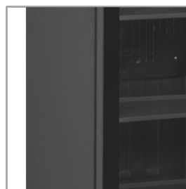
Dveře bez rámu