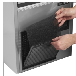
Snadné čištění filtru kondenzátoru