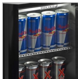
Ideální pro chlazení energy drinků