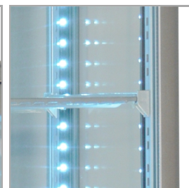
Detailní obrázek police