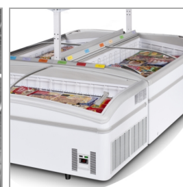
Instalace do ostrovů, police jako příslušenství