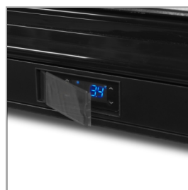
Ochranný kryt na termostat