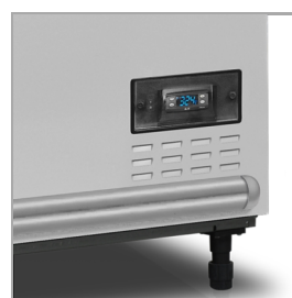
Digitální ukazatel teploty