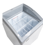
Systém dělicích přepážek