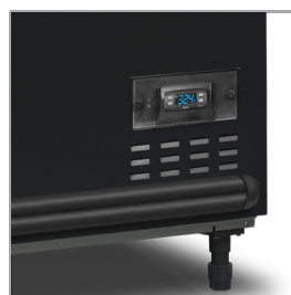
Digitální ukazatel teploty