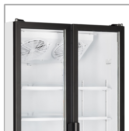
Dveře v plné výšce