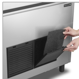
Snadné čištění filtru kondenzátoru