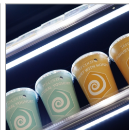
LED osvětlení pod každou policí