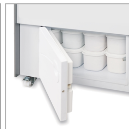
Snadno přístupný úložný prostor