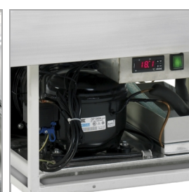
Automatické odpařování vody po odmrazení