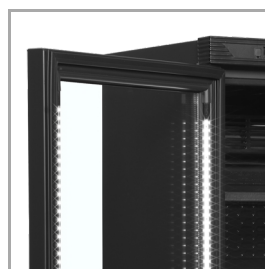
LED osvětlení v rámu dveří