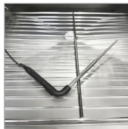
Vpichová sonda součástí