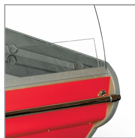
Vyhřívané přední sklo